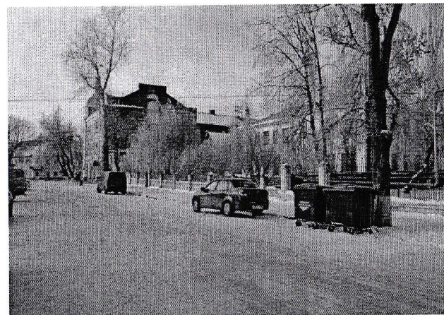
Фото подхода к зданию зимний период