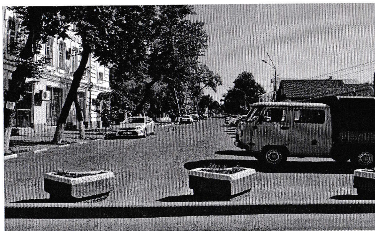
фото подхода к зданию летний период